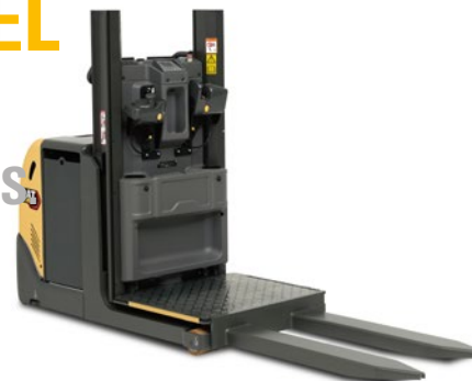
NOL10P 1200mm elevação da plataforma.

MELHORA A EFICIÊNCIA E A PRODUTIVIDADE COM O ORDER PICKER DE 2º NÍVEL E AS RESPECTIVAS OPÇÕES. SELECIONE UMA PLATAFORMA DE ELEVAÇÃO DE 1,2 OU 1,8 M, PROPORCIONANDO UM ACESSO RÁPIDO E FÁCIL PARA RECOLHAS ATÉ 2,8 OU 3,4 M.