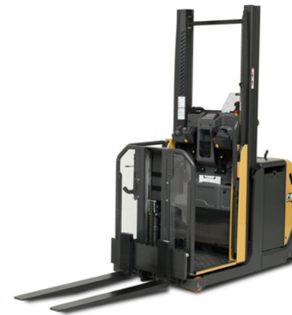
NOL10P 1800mm elevação da plataforma.