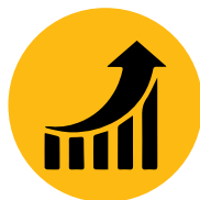
ПО-ДЪЛЪГ ПЕРИОД НА РАБОТА