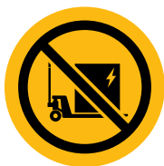
БЕЗ СМЯНА НА БАТЕРИИ