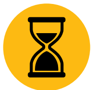
ПО-ДЪЛЪГ ЕКСПЛОАТАЦИОНЕН СРОК

Може би най-забележимата промяна при преминаването към литиево-йонните батерии е използването на зареждането при наличие на благоприятна възможност. Вместо да сменят батерии между смените, при кратките почивки можете просто да се включите в устройство за бързо зареждане и да поддържате активна една и съща батерия 24 часа в денонощието, 7 дни в седмицата. Това, заедно с други ефективни, екологични и свързани с безопасността ползи, прави литиево-йонните батерии много привлекателна алтернатива.