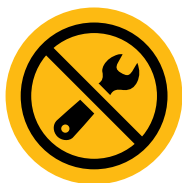
БЕЗ ЕЖЕДНЕВНА ТЕХНИЧЕСКА ПОДДРЪЖКА