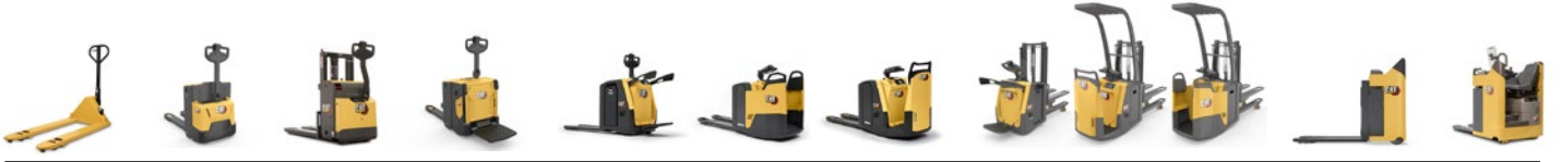
Akülü Palet Taşıyıcı yelpazesi: 1,6 - 2,5 ton kapasite