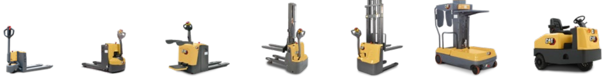
EQ Line: 0,15 – 6,0 ton kapasite