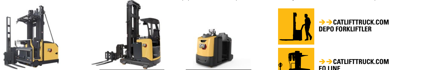
Man-Up Turret: 1,1 - 2,0 ton kapasite