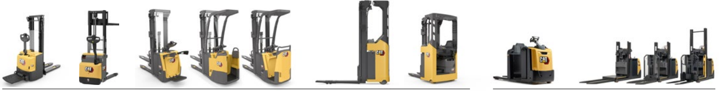
İstifleyici yelpazesi: 1,0 - 2,0 ton kapasite