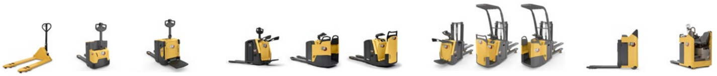
Línea transpaletas: 1.6 a 2.5 toneladas