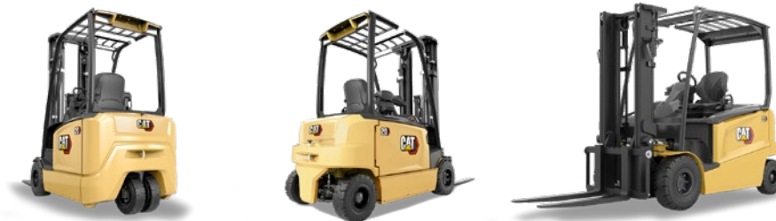
Línea eléctricas: 1.4 a 12.0 toneladas

→ CATLIFTTRUCK.COM CARRETILLAS ELEVADORAS CONTRAPESADAS