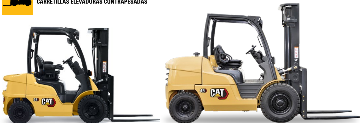
Línea diesel: 2.0 a 10.0 toneladas

→→ CATLIFTTRUCK.COM CARRETILLAS ELEVADORAS CONTRAPESADAS