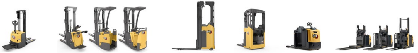
Línea apiladores: 1.0 a 2.0 toneladas