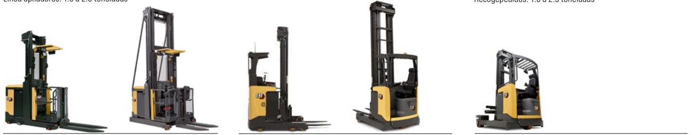
Línea retráctiles: 1.2 a 2.5 toneladas