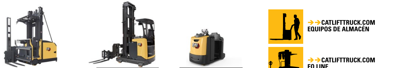
Carretillas tilaterales hombre arriba: 1.1 a 2.0 toneladas