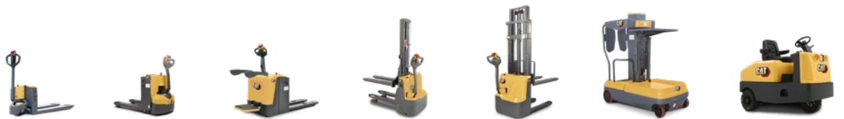
EQ Line: 0.15 a 6.0 toneladas