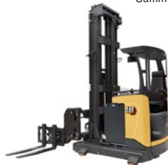
Chariots VNA Man-Down : 1,3 à 1,5 tonnes