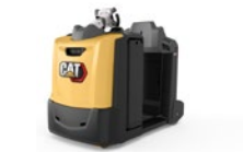
Tracteur : 3,0 à 5,0 tonnes