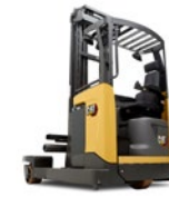
Chariots multidirectionnels : 2,0 à 2,5 tonnes