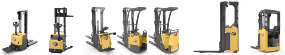
Gamme de gerbeurs : 1,0 à 2,0 tonnes