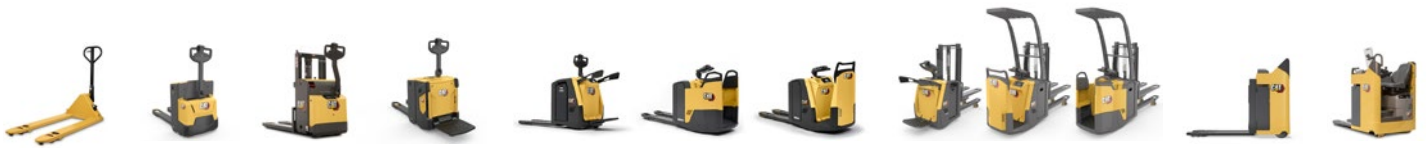
Gamme de transpalettes électriques : 1,6 à 2,5 tonnes