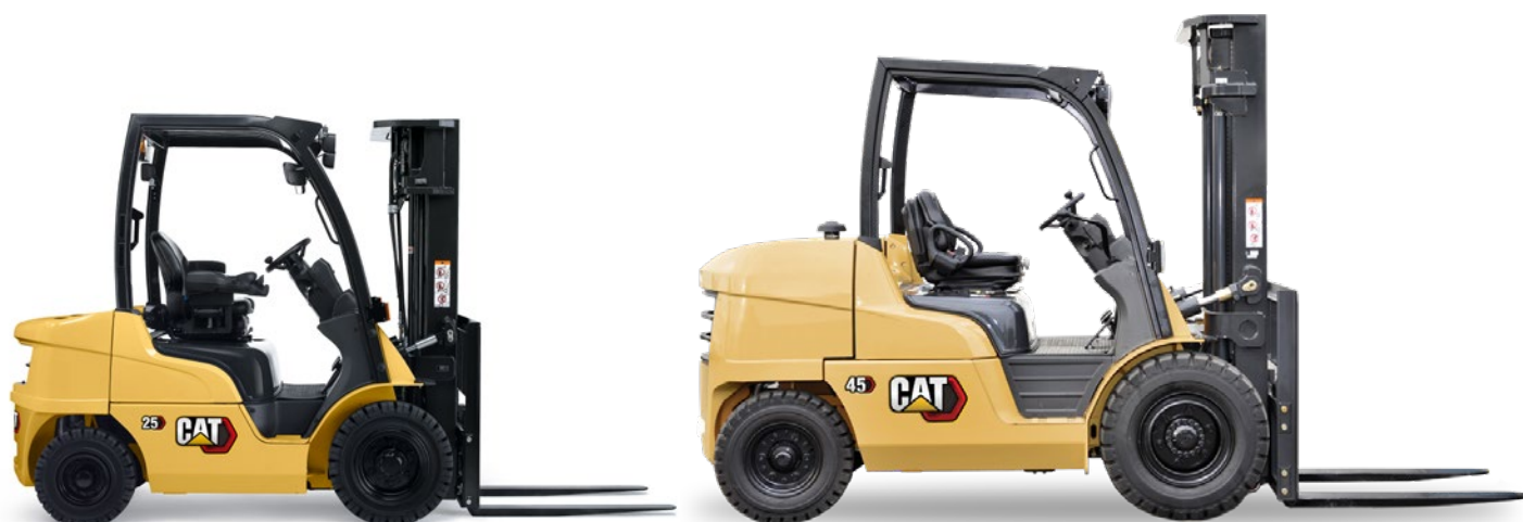
Gamme diesel : capacité de 2,0 à 10,0 tonnes