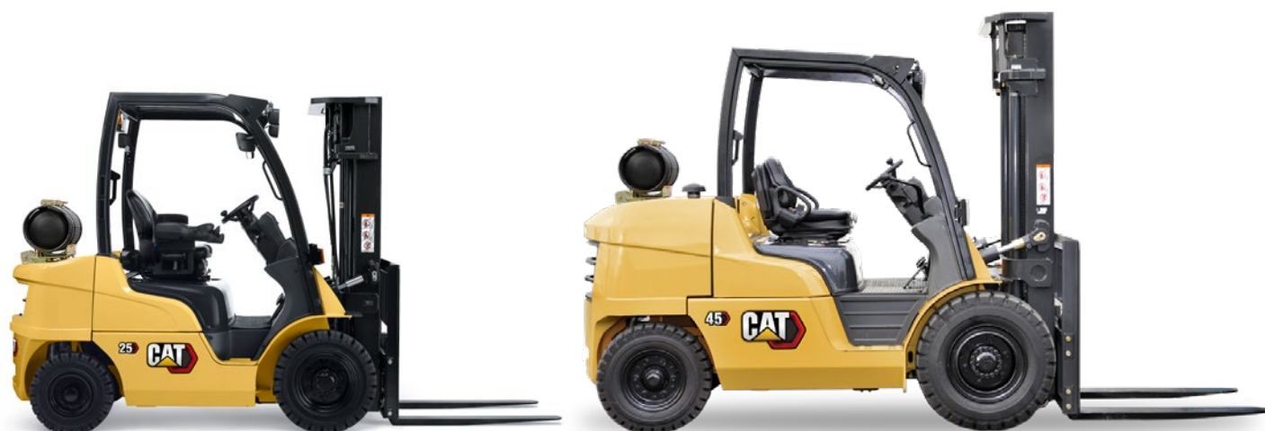
Gamme GPL : capacité de 1,5 à 5,5 tonnes