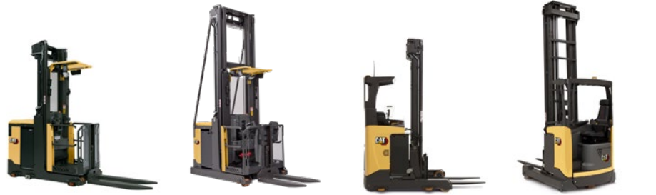
Gamme de chariots à mât rétractable : 1,2 à 2,5 tonnes